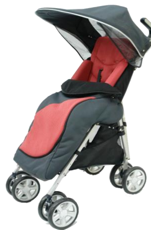
De getoonde productfoto kan afwijken van de standaard configuratie.